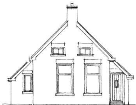
Verschillende varianten van krimpen.